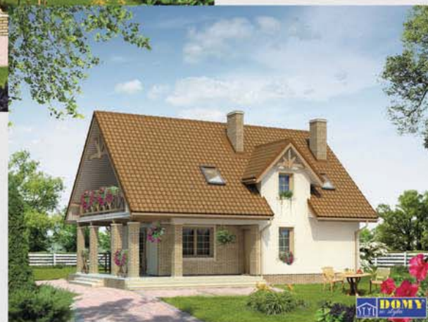
Autor: arch. Tomasz Sobieszuk, arch. Piotr Rynkiewicz