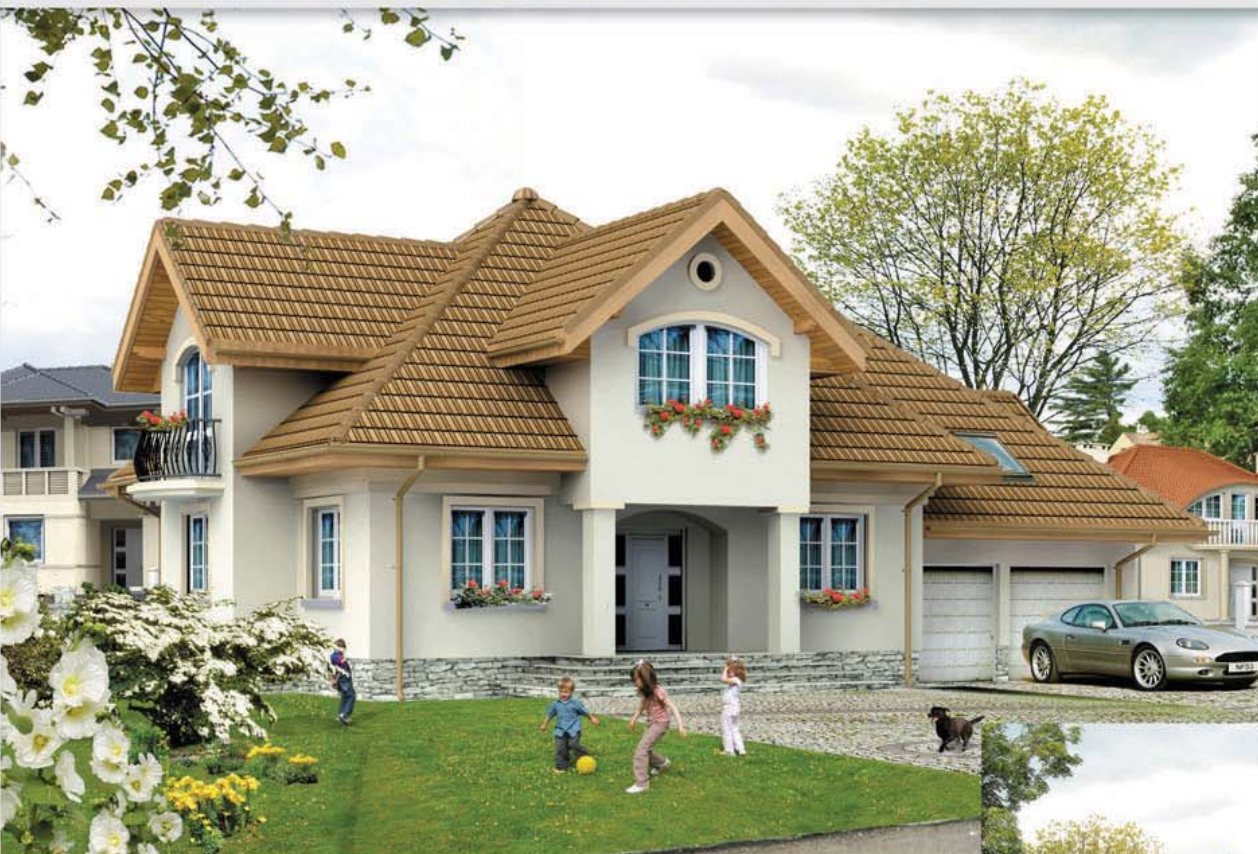
Autor: arch. Maciej Matłowski