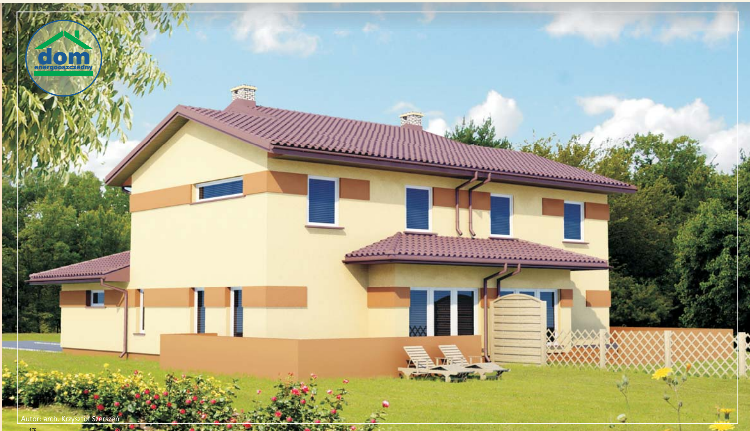
Autor: arch. Krzysztof Szerszeń