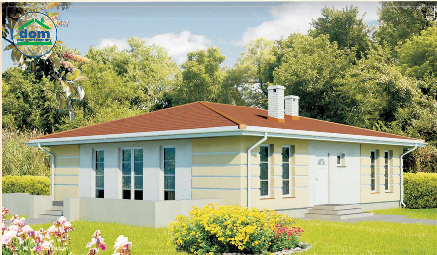
Autor: arch. Krzysztof Szerszeń